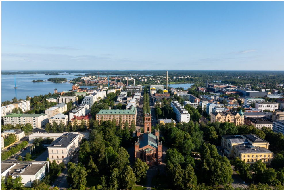
Somrig bild över Vasa