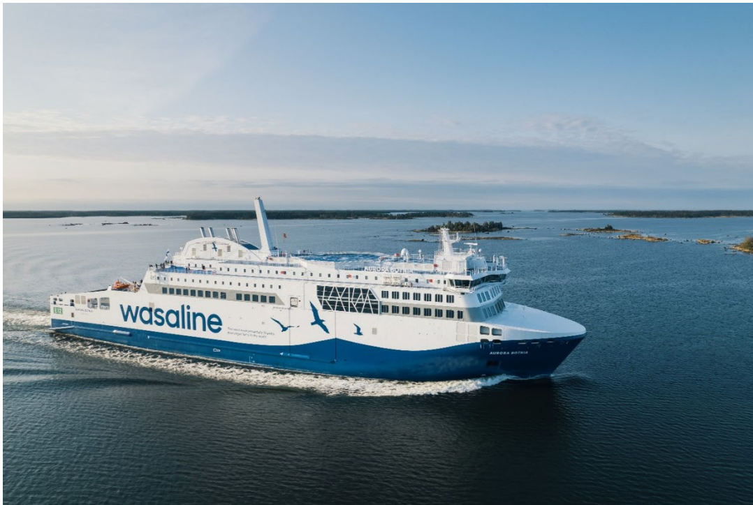
Aurora Botnias jungfruresa